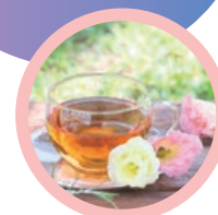
スイーツ、ドリンクの画像はイメージです