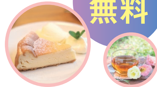
スイーツ、ドリンクの画像はイメージです